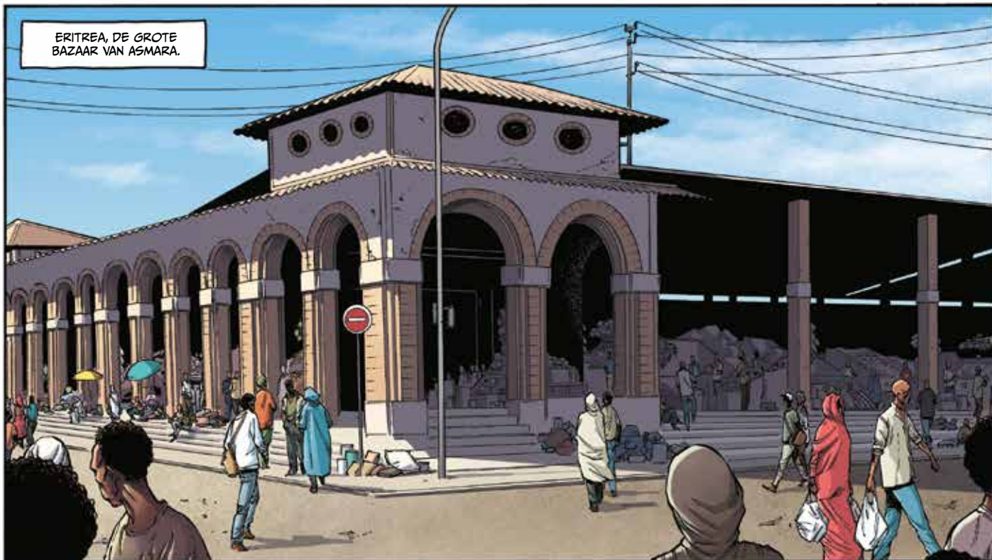
ERITREA, DE GROTE BAZAAR VAN ASMARA.