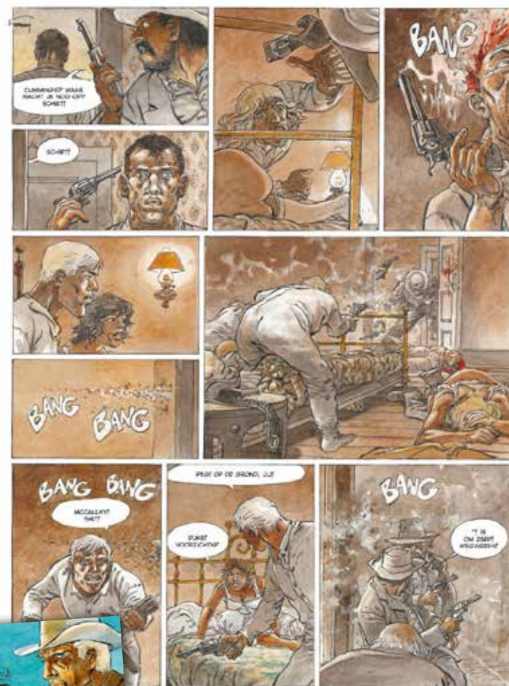
Fragment uit DUKE 1: MODDER EN BLOED . Op 78-jarige leeftijd startte Hermann op scenario van Yves H. weer met een westernreeks waarvan de tekenaar minstens vijf delen wil maken.

HERMANN: “Blijf mijn werk kopen, dan blijf ik bezig. Dat heb ik ook nodig voor mijn innerlijke gemoedsrust.”