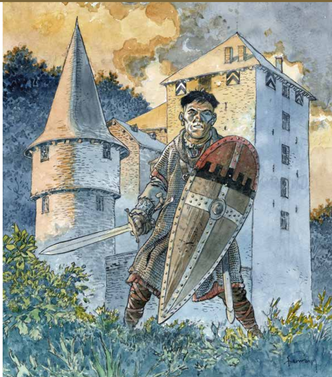
In 1985 start Hermann de reeks DE TORENS VAN SCHEMERWOUDE. Na de eerste cyclus van tien albums gaat de reeks verder met afgeronde verhalen per album over de nazaten van ridder Aymar van Schemerwoude.