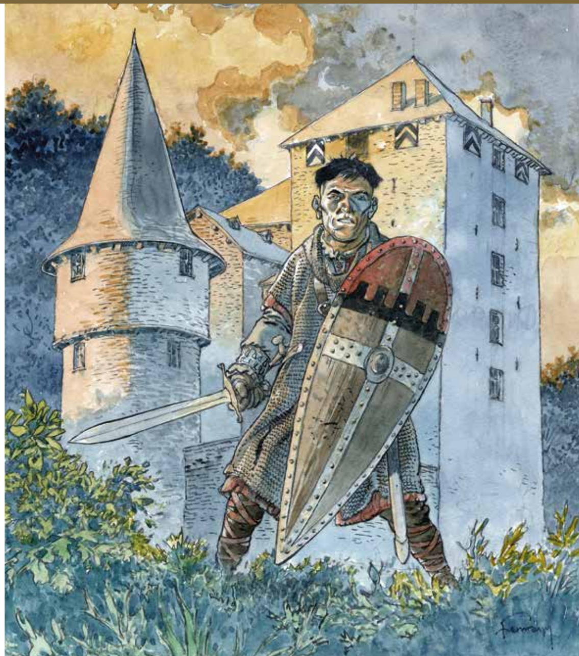
In 1985 start Hermann de reeks DE TORENS VAN SCHEMERWOUDE. Na de eerste cyclus van tien albums gaat de reeks verder met afgeronde verhalen per album over de nazaten van ridder Aymar van Schemerwoude.